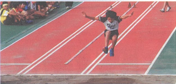
連合運動会走り幅跳び