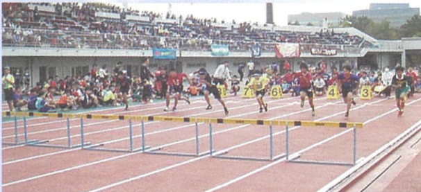
連合運動会50mハードル走

体力・運動能力を伸ばすよりよい指導をするために、教職員は、実技研修や指導法の研究に日夜取り組んでいます。